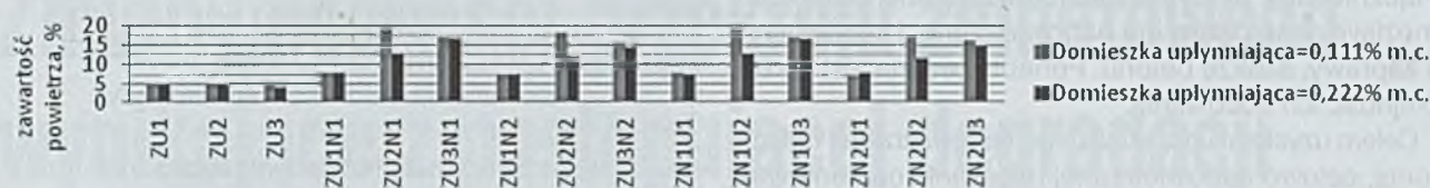
Rys. 1. Wyniki badań zaprawy wzorcowej