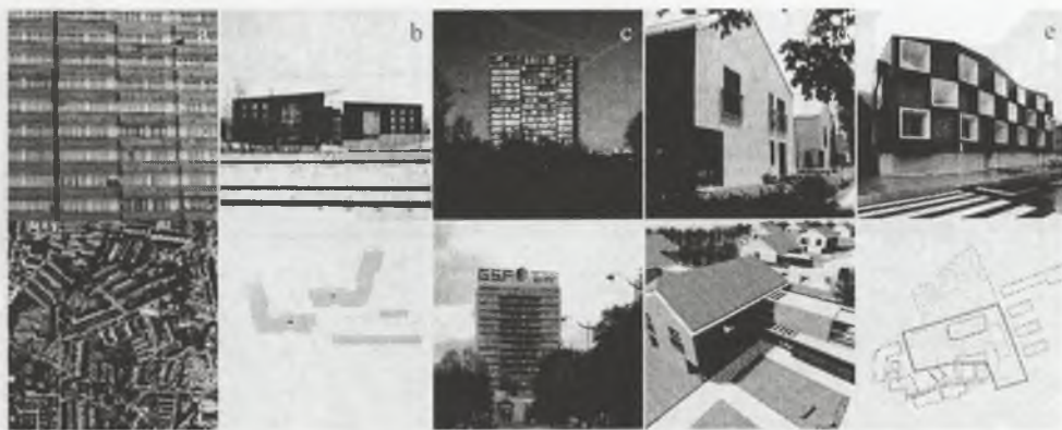
Rys. 5. a - przykładowe osiedle z wielkiej płyty, Polska; b - nowa zabudowa w Helsinkach, Finlandia; c - zmodernizowany blok z mieszkaniami socjalnymi w Paryżu, Francja; d - zespół mieszkań TBS w Stargardzie Szczecińskim, Polska; e - zabudowa dla górników w Deganie, Hiszpania Fig. 5. a - example estate of concrete slabs, Poland; b - new buildings in Helsinki, Finland; c - modernized social housing block in Paris, France; d - TBS housing estate in Stargard Szczeciński, Poland; e - buildings for miners in Degana, Spain