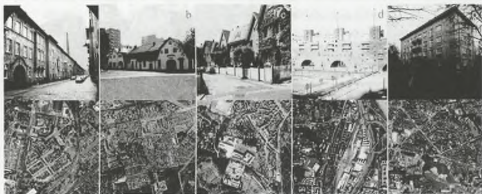
Rys. 4. Osiedla Nikiszowiec (a) oraz Giszowiec (b) w Katowicach, Polska; c - osiedle Hellerau pod Dreznem, Niemcy; d - Karl Marx Hof w Wiedniu, Austria; e - Nowa Huta w Krakowie, Polska