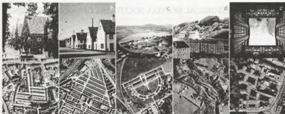
Rys. 1. a - osiedle Fuggerei w Augsburgu, Niemcy; b - osiedle Nyboder w Kopenhadze, Szwecja; c - Królewskie Saliny w Arc-et-Senans, Francja; d - zabudowa szeregowa w New Lanark, Szkocja; e - zabudowa mieszkaniowa, tzw. Mietskasernen w Berlinie, Niemcy