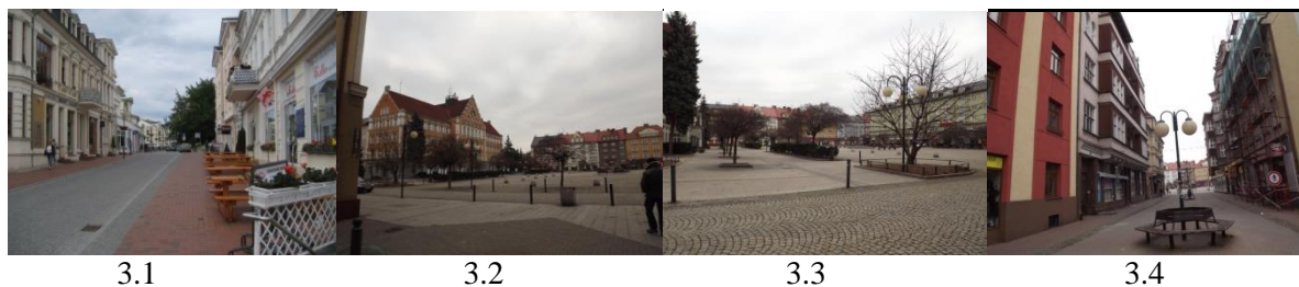
Rys. 3. Proporcje przestrzeni głównych ciągów komunikacyjnych, innych ciągów komunikacyjnych, placów – Ahlbeck, Niemcy (3.1.); Cieszyn, Czechy (3.2., 3.3., 3.4.)

Fig. 3. The proportions of the space of the main traffic routes, other routes, squares – Ahlbeck, Germany (3.1.); Cieszyn, Czech Republic (3.2., 3.3., 3.4.)