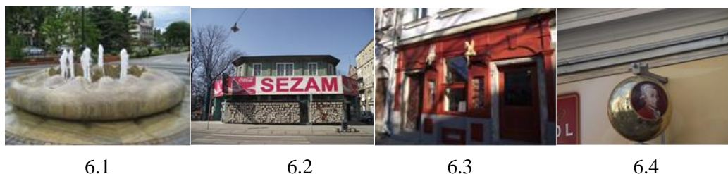
Rys. 6. Dominanty i charakterystyczne elementy: budynki, fontanny, pomniki, reklamy, symbole, tablice pamiątkowe – Świnoujście (6.1), Gliwice (6.2), Bielsko – Biała (6.3), Wiedeń Austria (6.4)

społecznych, ogólnodostępnych jak ratusze miejskie, obiekty handlowe jak na zdjęciu poniżej w Gliwicach, ale także występują inne np. domy mieszkalne, wyróżniające się estetyką, pełnią funkcję, charakterystyczne dla danego miasta (np. we Wiedniu, Austria, Dom Hundertwassera). Istnieje wiele przykładów indywidualizowania przestrzeni miejskiej w skali człowieka np. pomniki przedstawiające postacie lokalnych bohaterów, pisarzy, muzyków (np. w Żarach – prześladowane dzieci, w Zielonej Górze – elfy, w Łodzi – muzyk i kompozytor), miejsca pamięci upamiętniane poprzez tablice pamiątkowe (np. w Opawie – ostatnie szyny tramwajowe, w Międzyzdrojach – tablice z odciskami dłoni znanych aktorów, reżyserów i w Zielonej Górze – tablice upamiętniające wydarzenia, wartościowych ludzi), symbole i inne ozdoby ścienne, charakterystyczne dla danych obiektów, przestrzeni, które wyróżniają daną przestrzeń np. zindywidualizowane szyldy sklepowe w Cieszynie, w Tarnowskich Górach, czy też makiety miast, centralnych obszarów miejskich. Charakterystyczne jest także wyznaczanie poszczególnych ciągów komunikacyjnych dla rowerzystów, inwalidów, z zastosowaniem ograniczeń kolorystycznych bądź poprzez słupki, kule, czy inne elementy kamienne jak np. we Wiedniu (Austria), w Budapeszcie (Węgry). Stosowane są również takie elementy jak: charakterystyczne ławki w Guben (Niemcy), we Wiedniu (Austria), w Kielcach, hydranty (Toszek, Gliwice, Wiedeń).