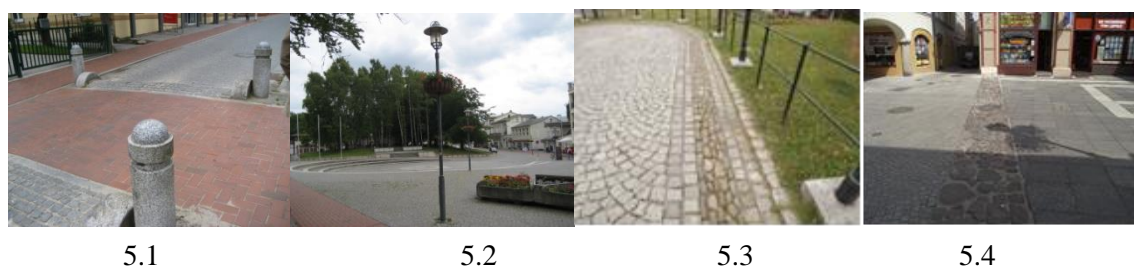
Rys. 5. Proporcje przestrzeni głównych ciągów komunikacyjnych, innych ciągów komunikacyjnych, placów – Ahlbeck, Niemcy (5.1, 5.2), Cieszyn (5.3), Zielona Góra (5.4)

Ciekawym przykładem jest zastosowanie materiałów budowlanych ze względu na ich sposób zastosowania w uwidocznieniach planów, fundamentów starych zabudowań w rysunku ułożenia bruku posadzki ulicy. Jak na zdjęciu poniżej w Zielonej Górze i we Wiedniu (Austria) zastosowano prosty, ale czytelny układ i materiał do odtworzenia dawnej zabudowy. Sposób ten jest indywidualny i charakterystyczny dla danego miasta.